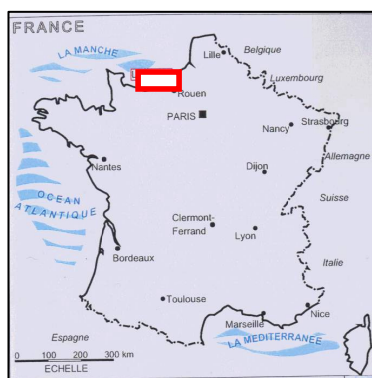
Figure 1 : Localisation du site.

Protection de la Nature) le 21 février 2001 et a reçu l'agrément de la Ministre de l'Aménagement du Territoire et de l'Environnement le 21 mai 2001.